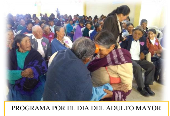
PROGRAMA POR EL DIA DEL ADULTO MAYOR