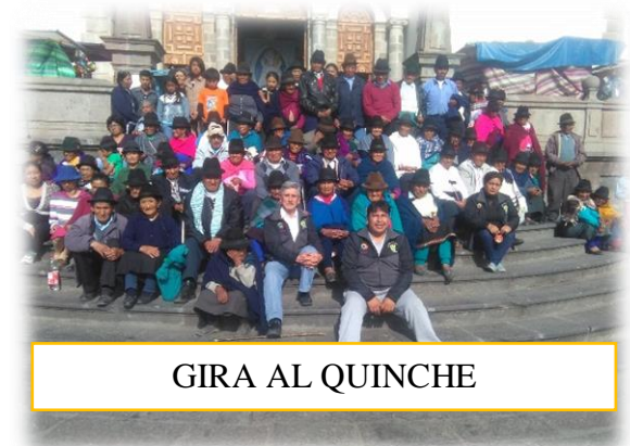
GIRA AL QUINCHE

APORTE MIES: $9032,94 APORTE GAD MULALILLO: $ 5258,43 INVERSION TOTAL: $14291,37