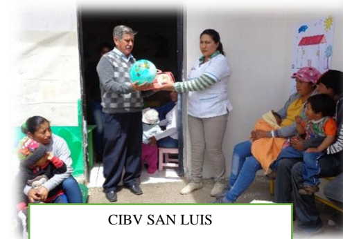
CIBV SAN LUIS