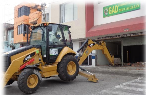
ADECUACIÓN A LA ENTRADA DEL GAD