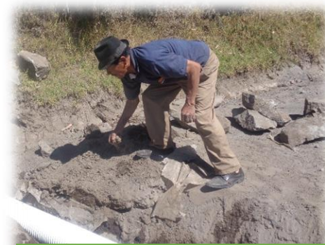
TUBOS CORRUGADOS VÍA LA GLORIA -SALATILIN