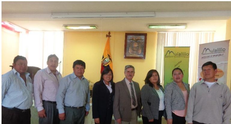
FUNCIONARIOS GOBIERNO AUTÓNOMO DESCENTRALIZADO PARROQUIAL RURAL MULALILLO