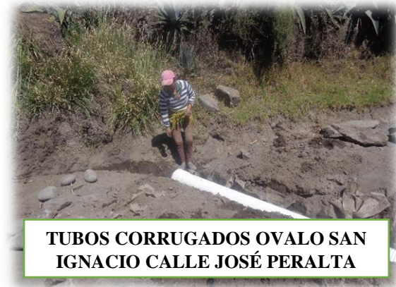
TUBOS CORRUGADOS OVALO SAN IGNACIO CALLE JOSÉ PERALTA