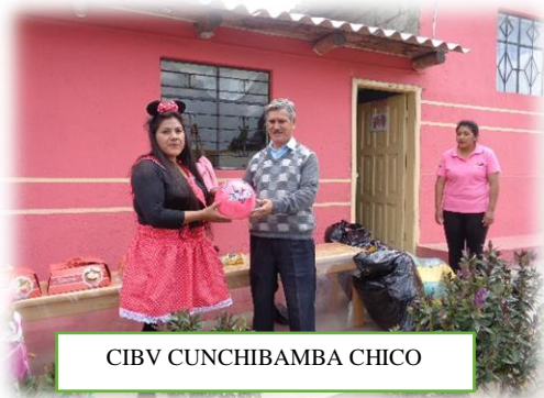
CIBV CUNCHIBAMBA CHICO